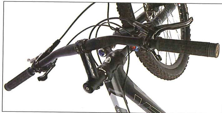
Dit 'Ultra bend' stuur hoort er echt bij

Gary Fisher was zo'n tien jaar geleden een van de eersten met een 29-er. Sinds dit jaar is het merk Gary Fisher onderdeel van Trek. Dat betekent dat Trek geen eigen 29-ers meer nodig heeft, en dat je bij iedere Trek-dealer terecht kunt. Vandaar dat deze Paragon een Gary Fisher is, by Trek . Of zoiets. Een lange bovenbuis moet zorgen voor stabiliteit, een korte stuurpen voor wendbaarheid. De Bontrager Ultra Sweep is een gewoon 'vlak' stuur, maar dan wel zo breed en ver naar achteren gebogen dat je met je handen breeduit nauwelijks voor het balhoofd zit. Dat is even wennen. Daarmee vergeleken ziet de rest van de fiets er bijna normaal uit. Grijstinten, ge-