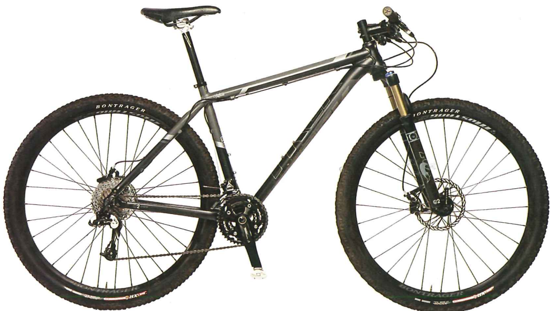
Trek Gary Fisher Paragon

den ze altijd meer grip bij minder rolweerstand. Daarnaast maken ze de Paragon comfortabeler en voorspelbaarder dan hij ooit zou zijn met 26 inch wielen. De zwakke plekken zitten in de afmontage, en dan vooral de SRAM X.7-shifters. Deze zijn van het nieuwste 10-speed type en bleven door de modder vaak hangen. Na opschakelen kwam de hendel niet vanzelf terug. Dat is geen ramp, maar het hoort niet in deze prijsklasse. Jammer ook, want de 3x10 versnellingen functioneren prima op deze 29-er; de stapjes zijn aangenaam klein en dat is op zo'n soepel rijdende fiets een pré.