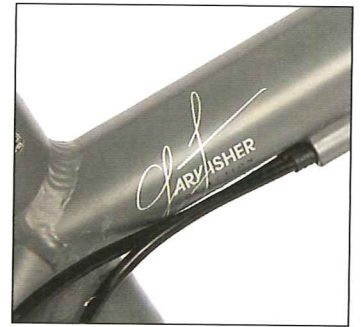
G2, bedacht door een (eigen)wijze oude man